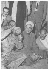
عبد الناصر مع الشيخ الباقوري وسط الجماهير